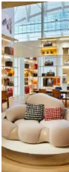
Estilista de interiores para tiendas de retail