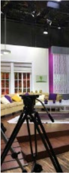
Diseñador de sets