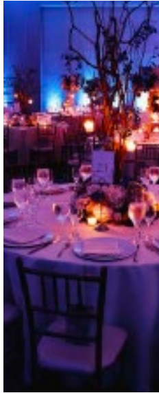
Creativo interiorista para eventos