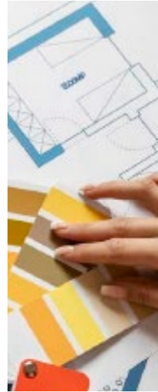
Diseñador de ambientes de casa