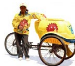
Miguel Aguirre (2012) Tipos de Lima. [Óleo sobre papel]