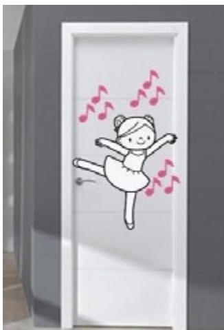
Pinterest (s.f.). Decoración para puerta de cuarto de niña. https://ar.pinterest.com/pin/726416614877264712/