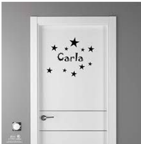
Pinterest (s.f.). Decoración para puerta de cuarto de niña. https://ar.pinterest.com/pin/453034043763936768/

Muchos estudiantes tienen objetos con los que guardan una especial relación, algunos pueden ser objetos netamente personales y otros de mayor utilidad en nuestro día a día, como un escritorio, la cómoda, una mochila e incluso la puerta de nuestro dormitorio. Estos objetos podrían pasar desapercibidos por largos periodos de tiempo, sin embargo, nuestra propia convivencia con ellos, hace que generemos vínculos que se manifiestan a través de inscripciones visuales. Es ese quehacer cotidiano que nos hace colocar imágenes o texto sobre la superficie de los objetos. Por ejemplo, analicemos estas dos imágenes: