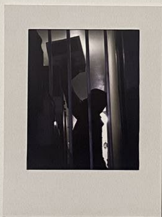
Encarcelado en la esclavitud del trabajo. Impreso en papel photo Rag Baryta