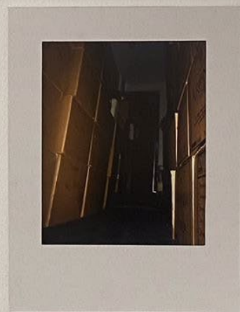
La prisión del éxito. Impreso en papel photo Rag Baryta