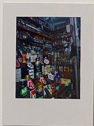
Ahogamiento en el mar del trabajo. Impreso en papel photo Rag Baryta