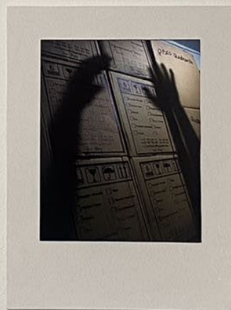
La silueta de la desesperación. Impreso en papel Photo Rag Baryta