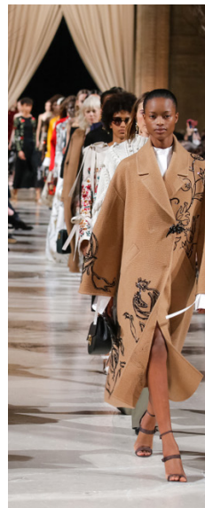
Productor de eventos de moda