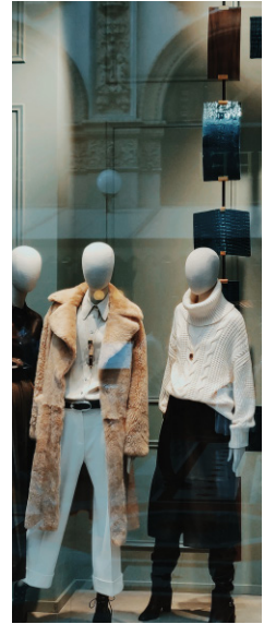
Encargado visual de tienda