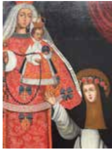
(Detalle de la obra) Colección Barbosa-Stern

Se cuenta que en un Domingo de Ramos, Jesús se manifestó a Santa Rosa de Lima por medio de una escultura de Cristo niño. Esta adquirió vida para pedirle a la santa que sea su esposa.