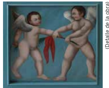
(Detalle de la obra)

En la mitología griega, Eros y Anteros encarnan al amor profano y al amor puro, respectivamente. Anteros defendía el amor correspondido que destruía Eros, lucha simbolizada en el acto de quitarse la hoja de palma.