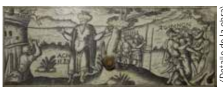
(Detalle de la obra)

Homero cuenta en la Iliada que un furioso Aquiles decidió dejar de pelear contra los troyanos cuando el rey Agamenón le arrebató a su esclava favorita, Briseida, a quien amaba intensamente.